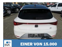
EINER VON 15.000