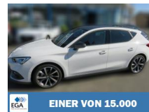
EINER VON 15.000