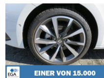
EINER VON 15.000