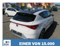
EINER VON 15.000