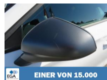
EINER VON 15.000