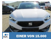
EINER VON 15.000