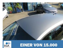
EINER VON 15.000