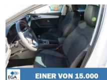
EINER VON 15.000